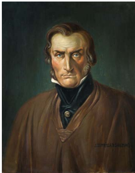
JOSÉ LUIS ZORRILLA DE SAN MARTÍN OLEO SOBRE TELA 60 X 76 CM 1940

Esta es una de las imágenes más conocidas de José Artigas, reproducida reiteradamente en álbumes, libros de historia, cuadernos y hojas escolares. Sobre su caballo, al borde de la meseta del Hervidero en el departamento de Paysandú, José Artigas fija su mirada en el horizonte del protectorado de los pueblos libres, que se adivina al otro lado del río Uruguay, más allá del límite derecho de la tela. Esta representación evoca al estadista en el período de máxima extensión de la Liga Federal, entre 1815 y 1816. El catalejo que Artigas sostiene en su mano derecha alude a la extensión regional de su proyecto. Se trata de una pintura de tinte localista, realizada en 1911 en el marco de la celebración de los centenarios de la independencia. Esto se advierte en el paisaje, por el tratamiento del cielo y de la luz, de la geografía y de la geología del río. Por ejemplo en los tonos rosados de las orillas y de las playas de las islas que reproducen la coloración natural que les otorga la concentración de guijarros en las playas de ripio. El caballo y sus aperos, el poncho como prenda típica rioplatense, exaltan aquellos elementos que se consideraban esencia de la nacionalidad. En perspectiva distorsionada la meseta se transforma en el pedestal de un monumento ecuestre.