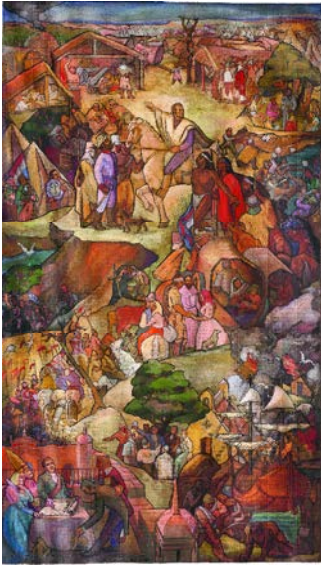
PEDRO MIGUEL ASTAPENCO CARMEN GARAYALDE AMALIA POLLERI ÓLEO SOBRE FIBRA. BOCETO PARA UN MURAL 95 X 150 CM CA. 1950