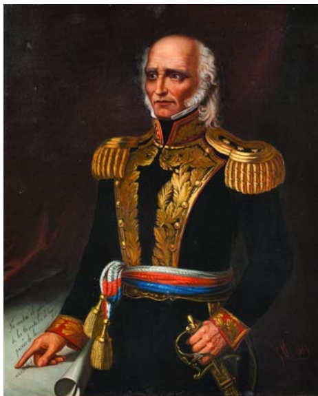
JOSÉ MARASCHINI ÓLEO SOBRE TELA 86 X 106 CM 1884