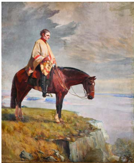
CARLOS MARÍA HERRERA OLEO SOBRE TELA 378 X 309 CM 1911