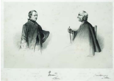
DIBUJO DE ALFRED DEMERSAY LITOGRAFÍA SOBRE PAPEL DE C. SAUVAGEOT 41,5 X 25 CM DIBUJOS CA. 1847, LITOGRAFÍA 1865