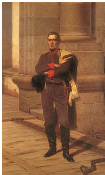
JUAN MANUEL BLANES ÓLEO SOBRE TELA 119 X 182 CM CA. 1884

El retrato de Maraschini cumple con una de las formas que, en la década del ochenta del siglo XIX, correspondía a la de un “Héroe” de la patria. La construcción de una gesta heroica fundacional para las naciones exaltó las glorias militares de la independencia. Los generales fueron retratados al estilo napoleónico: portan uniformes de gala cargados de entorchados, charreteras, armas y condecoraciones, en permanente alusión al poder, aunque Artigas nunca usó esta vestimenta si atendemos a las descripciones de sus contemporáneos. Esta línea de representación ya había sido ensayada por varios artistas del siglo XIX, como el limeño José Gil de Castro, quien pintó a otras figuras de la independencia americana como San Martín, Bolívar y O’Higgins. El uniforme que lleva Artigas en este cuadro es muy parecido al que usa Fructuoso Rivera, primer presidente de la República Oriental del Uruguay en el retrato que pintó Amadeo Gras en 1833. Esta vestimenta imprime a José Artigas el carácter de primer gobernante de los uruguayos.