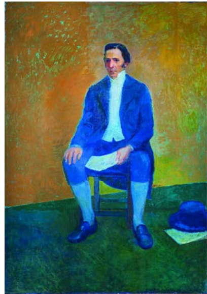
ANHELO HERNÁNDEZ ÓLEO SOBRE TELA 121,5 X 172 CM 2007

Esta obra recoge características del muralismo mexicano por su lenguaje plástico y por su compromiso político y social, con una historia de los pueblos y de la identidad latinoamericana. Se trata de una composición abigarrada, ordenada geoméricamente, en la que se desarrolla una interpretación de la revolución y sus antecedentes en un único registro ascendente hasta la instalación del campamento en el Ayuí, entre 1811 y 1812. De acuerdo con la explicación proporcionada por los autores, en el sector inferior, a la izquierda, se representa la Ciudadela, en cuyo interior las potencias imperiales acuerdan la entrega de la Banda Oriental a los peninsulares. A la derecha, la estructura económica colonial se muestra con el puerto de Montevideo por donde se extraía la riqueza pecuaria y por donde ingresaban los esclavos. En el segundo sector, a la izquierda, se ve el fin del Sitio de Montevideo, con la partida del ejército oriental acompañado por el pueblo. A la derecha, la asamblea ciudadana manifiesta su rechazo al levantamiento del sitio, mientras arden los ranchos de los pobladores que optan por seguir a Artigas. En el centro puede verse la figura de Artigas y en lo alto los logros del nuevo orden revolucionario: la instalación de la escuela, los talleres, la capilla y la relación con las provincias.