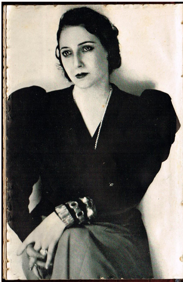
Juana de Ibarbourou Fotografía incluida en el libro Estampas de la Biblia . Montevideo: Sociedad de amigos del libro rioplatense, 1934.

Personalidad de la cultura uruguaya, cuya proyección permitió su consagración como Juana de América, galardón entregado el 10 de agosto de 1929, en el Salón de los Pasos Perdidos del Palacio Legislativo, de la mano de Juan Zorrilla de San Martín.