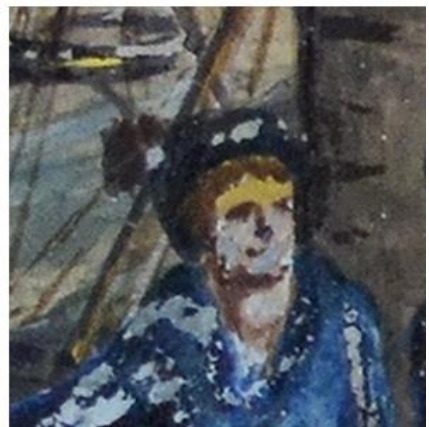
Encallamiento del vapor "Gorgon" Juan Manuel Besnes e Irigoyen, 1844 Acuarela y tinta sobre papel 23 x 12,2 cm